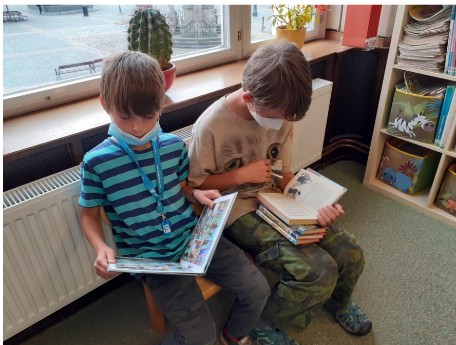
Setkání klubíku Dráček