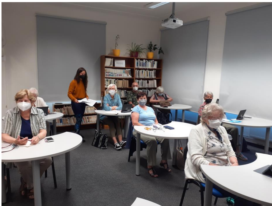
Digitální vzdělávání 65+ „Jak na chytrý telefon a tablet“ 10. června 2021