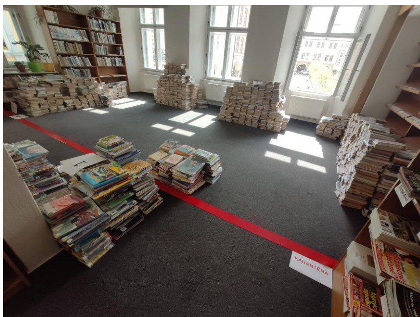
Knihy v karanténě