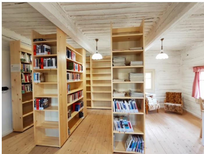
Nová knihovna v Hajnici