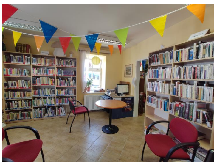
Knihovna v Lánově