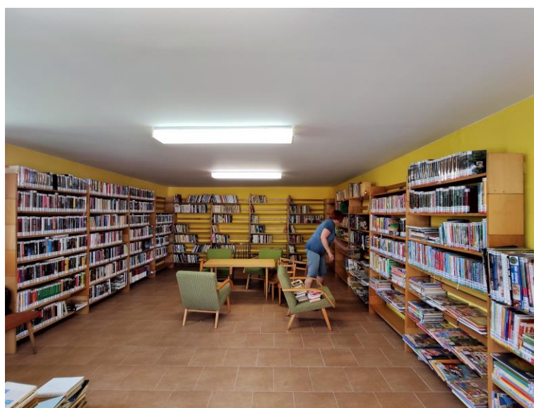
Revize a aktualizace fondu v knihovně Velké Svatoňovice