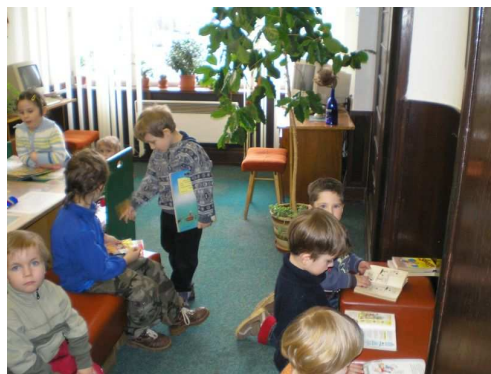
Děti z mateřské školky